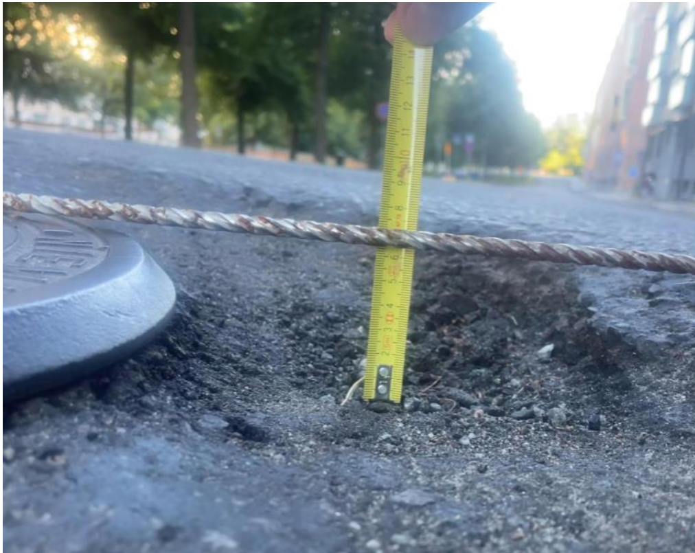
LIITE 2: Korjaus 13.7.2022